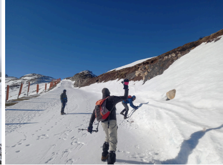
Rutas de montaña