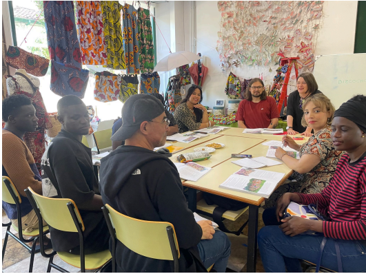
Clases de español de mañana

En 2025 hemos contado con la colaboración de 75 voluntarios participando en todo tipo de actividades.