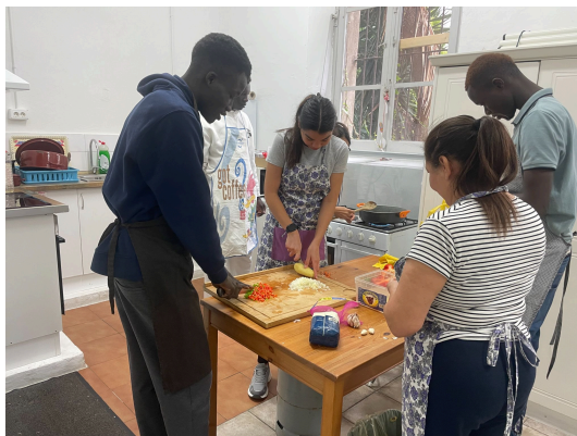
Cocinando para casa