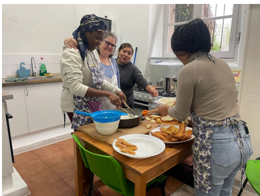
Clases de cocina