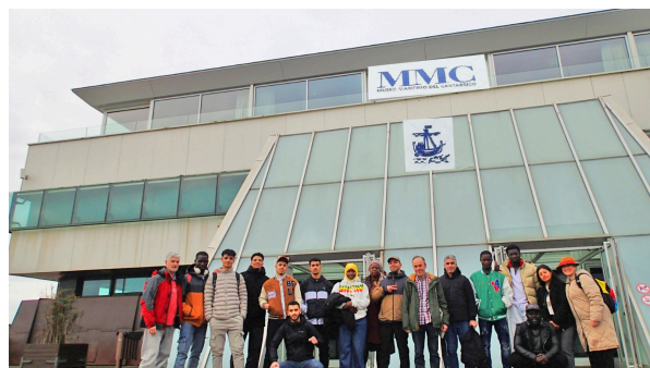
Visita al Museo Marítimo del Cantábrico