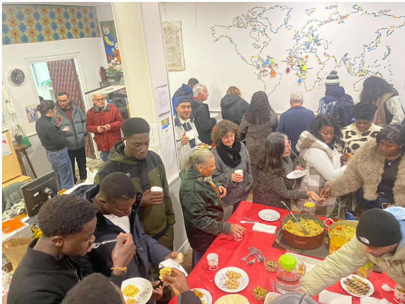
Celebrando el fin de año