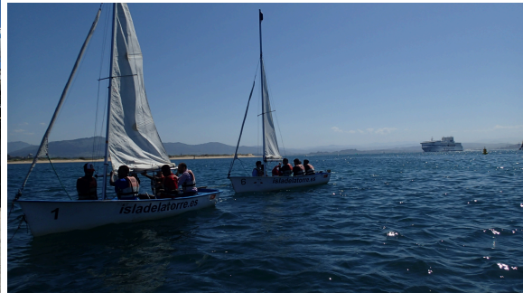
Escuela de vela Isla de la Torre