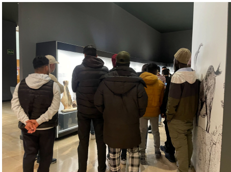
Visita al MUPAC