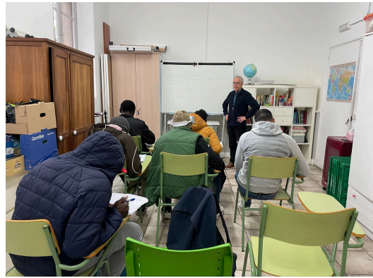
Clases de español de tarde